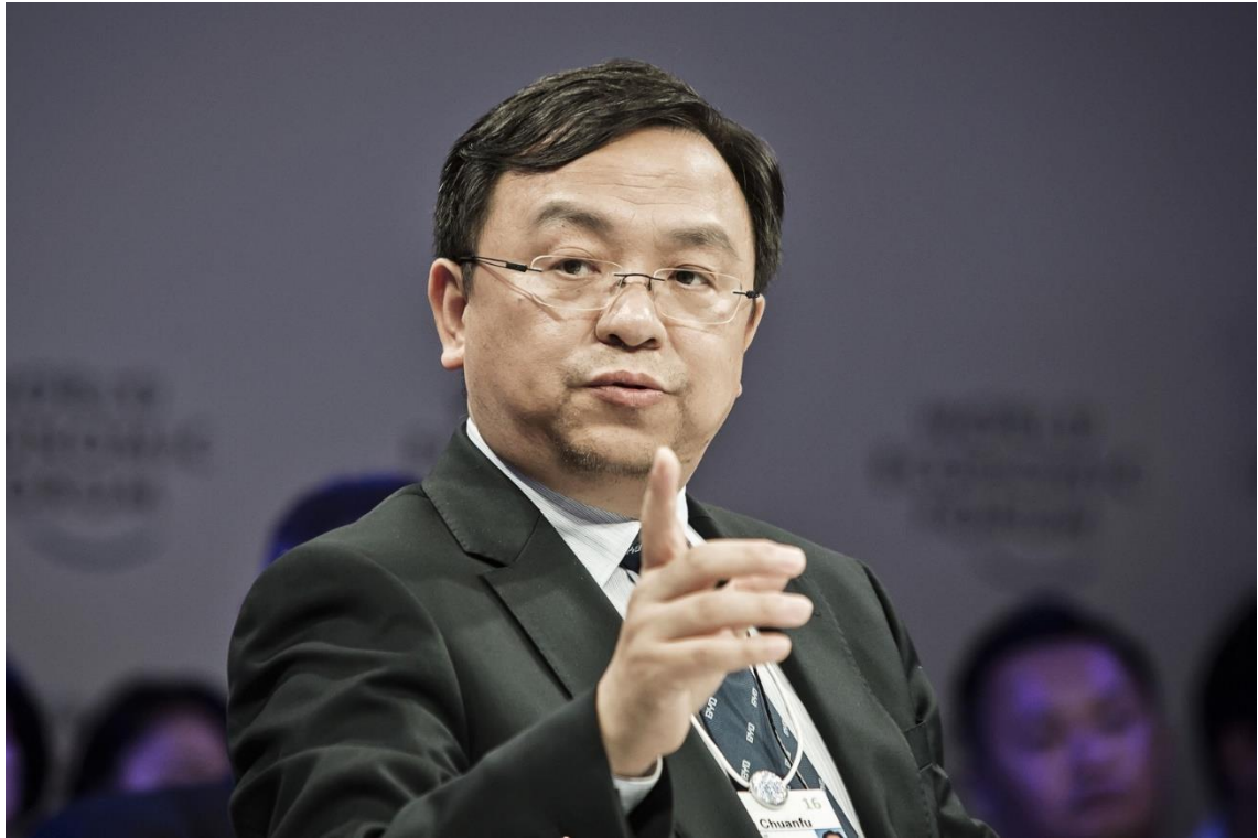
比亞迪創辦人王傳福 ( Getty Images )

不只瞄準國內，比亞迪也正引領中國企業的海外擴張浪潮，預計今年出口量將成長 6 倍，達到 30 萬輛。